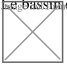
Insertion du bassin de la Galtière dans la rue éponyme

Bassin de la Galtière Rue de la Galtière